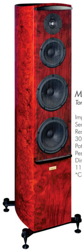
MAGNUM 2 Torre

Impedância: 4 ohms Sensibilidade: 86 dB Resposta de Frequência: 30 Hz - 40 kHz Potência Nominal: 150 W Peso: 35kg/pc. Dimensões (A x L x P): 1170 x 260 x 430 mm *Com tela