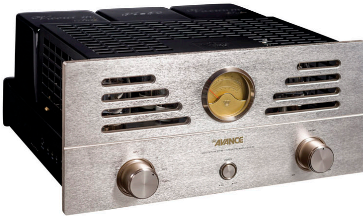
A50 Amplificador Valvulado

Potência de Saída: 50 W x 2 Impedância: 8 ohms Resposta de Frequência: 20 Hz - 30 kHz Sensibilidade: 90 dB THD: \leq 0.5\% Peso: 26kg/pç. Dimensões (A x L x P): 215 x 430 x 400 mm