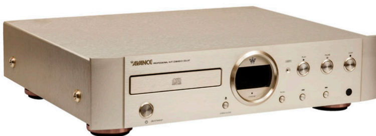
CD 2.0T CD & HDCD Player

Potência de Saída: 120 W x 2 Impedância: 8 ohms Resposta de Frequência: 10 Hz - 50 kHz Sensibilidade: 88 dB THD: 0.3% - 8 ohms - 1 kHz Peso: 50kg/pç. Dimensões (A x L x P): 245 x 444 x 545 mm