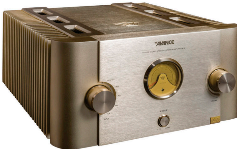
A30 Amplificador Integrado | Classe A

Potência de Saída: 50 W x 2 Impedância: 8 ohms Resposta de Frequência: 20 Hz - 30 kHz Sensibilidade: 90 dB THD: \leq 0.5\% Peso: 26kg/pç. Dimensões (A x L x P): 215 x 430 x 400 mm