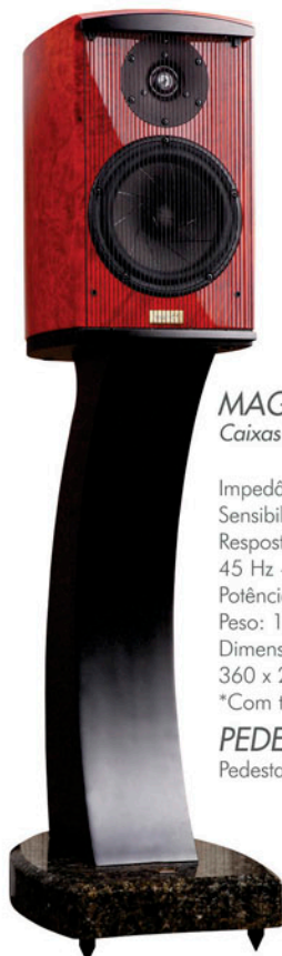
MAGNUM 13 Caixas Frontais

Impedância: 6 ohms Sensibilidade: 88 dB Resposta de Frequência: 25 Hz - 30 kHz Potência Nominal: 240 W Peso: 60kg/pc. Dimensões (A x L x P): 1520 x 660 x 330 mm